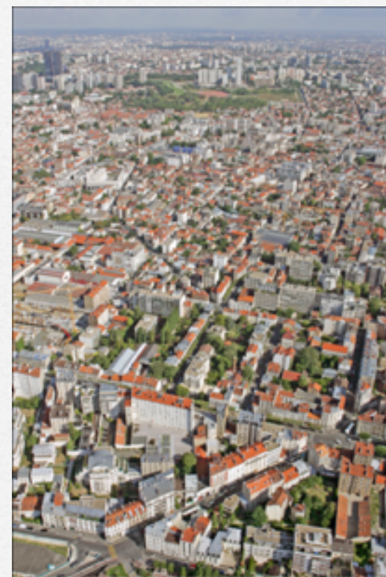
Vue 2 - n° 5025. Axe vers F. Arago/D. Buisson depuis Vincennes vers les Guillotins. Vue vers le Nord. Photo Y. Prouzet (Janvier 04/2010)