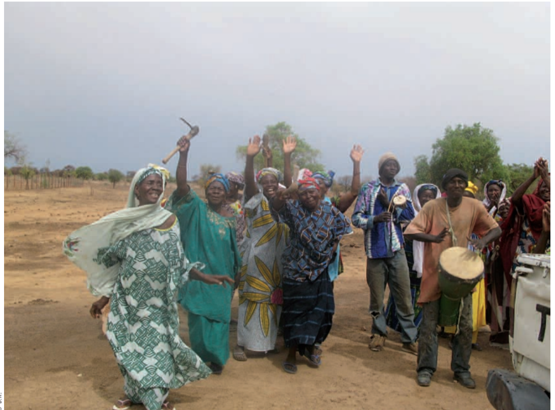
Les femmes sont fières de présenter leur périmètre maraîcher.

Déterminée à conserver des rapports privilégiés avec le cercle de Yélimané, la Ville de Montreuil est en attente, avec ses partenaires du Sud et les migrants, de la nouvelle formulation du PADDY, qui incombe à la FAO*. Mais, c'est le gouvernement malien et lui seul qui décidera de reconduire ou non la coopération avec le Vietnam, « Montreuil