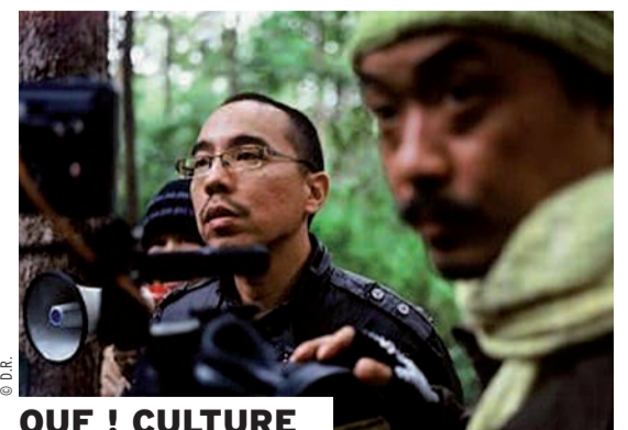
OUF ! CULTURE

Un programme pour toutes et tous dans les quartiers, des sorties, des séjours, des animations... Mais aussi, et surtout, de la solidarité et de la tranquillité au quotidien, pendant que les écoles font peau neuve et que les chantiers avancent partout dans la ville pour préparer la rentrée et faire aboutir les projets d'avenir. PAGE 4