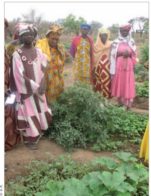
Ce sont les femmes qui cultivent le maraîchage.

* Food and Agriculture Organization : Organisation des Nations unies pour l'alimentation et l'agriculture.