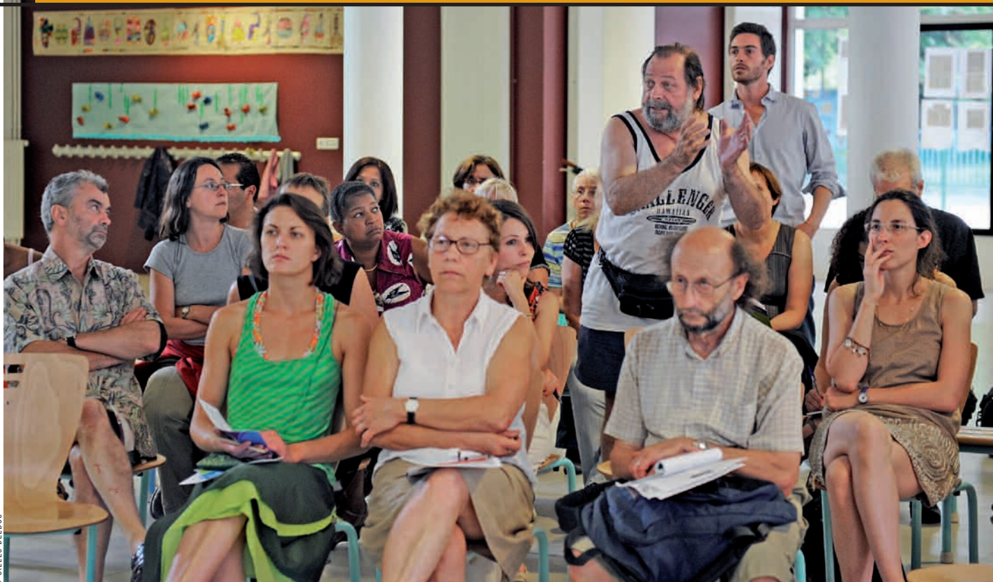
Une soixantaine de personnes ont participé à la réunion publique du 28 juin à l'école Nanteuil.

Par la convention d'équilibre habitat/activités signée avec l'État, la Ville a annoncé qu'elle autoriserait la construction de 3 500 logements entre 2009 et 2013. On est en avance par rapport au phasage prévu. En 2009, 579 logements ont été autorisés contre les 400 prévus initialement. Pour 2010, 500 logements devaient être : à la mi-juin, nous avons déjà remis des permis de construire sur 474 logements. ●