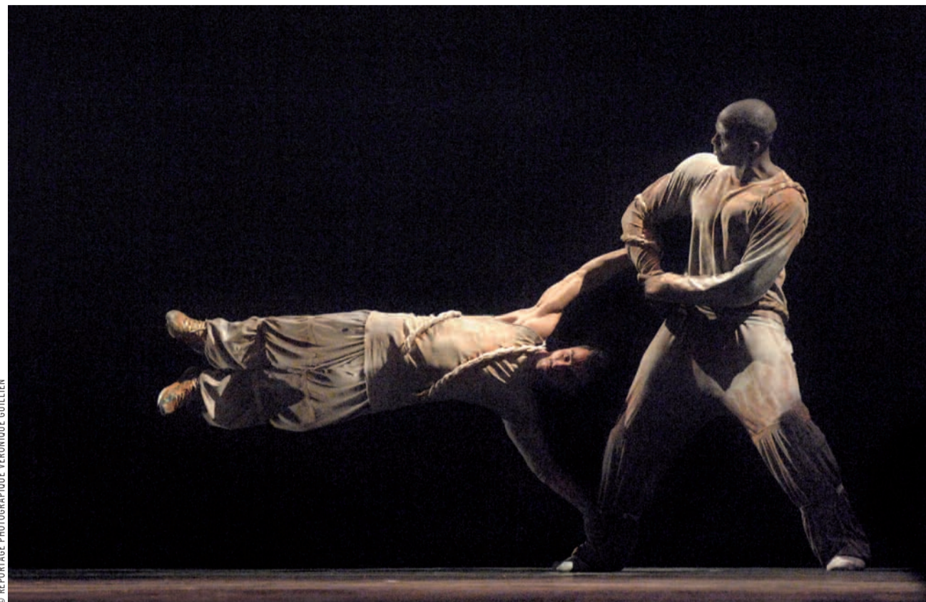
Le hip-hop montreuillois en apesanteur au Casino de Paris le 26 juin.