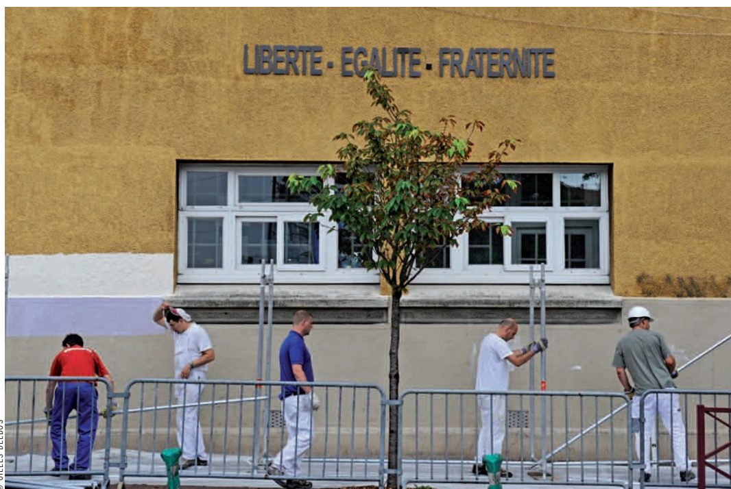
Les travaux à l'école élémentaire Boissière.

Entre 2009 et 2010, trente-neuf écoles sur les quarante-six que compte la ville auront bénéficié de travaux de rénovation et d'amélioration indispensables. Le budget dédié à cet effet a été doublé en 2009 et reconduit en 2010. Durant les vacances scolaires, pas moins de dix-huit écoles et centres de loisirs sont concernés. Tour d'horizon des chantiers de l'été.