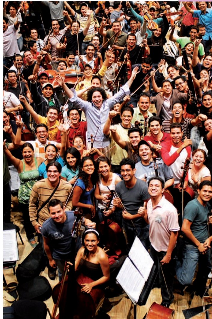
Âgés de 12 à 19 ans, venus des quartiers pauvres de Caracas, les choristes de la Schola Juvenil de Venezuela accèdent à la musique et au chant grâce au programme El Sistema .

Considéré aujourd'hui comme l'un des projets de réinsertion les plus exemplaires, El Sistema a été imaginé par José Antonio Abreu, homme politique et musicien vénézuélien qui a conçu un programme éducatif musical comme « un modèle de progrès social ». Soustraits parfois dès l'âge de 2 ans aux dangers de la rue, les enfants sont accueillis dans des centaines de centres créés parmi les différentes communautés. Instrument de musique, éducation musicale, soutien social leur offrent l'opportunité de trouver leur place au sein d'un groupe, dans un lieu réconfortant, six jours par semaine, quatre heures par jour. Encouragés dans leur parcours, certains poursuivent une carrière professionnelle et rejoignent des orchestres prestigieux. Pour le fondateur d' El Sistema , « la musique, comme expression ineffable et mystérieuse, et pourtant puissante et passionnée de l'amour, peut procurer à la