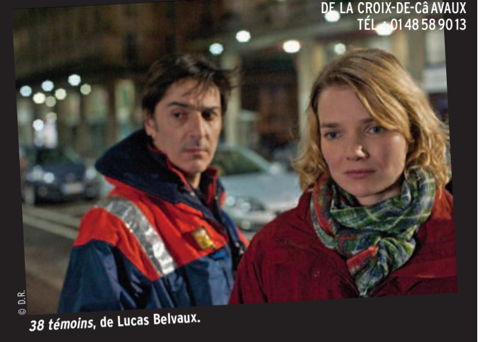
38 témoins, de Lucas Belvaux.

CINÉMA MUNICIPAL GEORGES-MÉLIÈS, CENTRE COMMERCIAL DE LA CROIX-DE-CÂ AVAUX TÉL. : 01 48 58 90 13