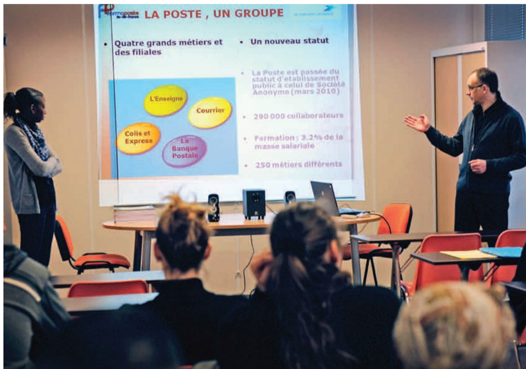
Une séance de recrutement organisée dans les locaux montreuillois du centre Formaposte.

Depuis quelques mois, Montreuil abrite Formaposte Île-de-France, un des trois centres de formation de La Poste. Vendredi 23 mars, Formaposte et les opportunités d'embauche qui vont avec vous seront présentées à l'occasion d'un Matin de l'emploi.