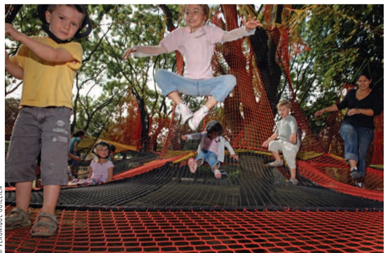
Le Parcabout, un formidable filet d'aventures au parc Montreuil.

Une gigantesque toile d'araignée de 2000 m 2 , tissée avec des cordages marins au milieu des arbres, à des hauteurs de 4, 6 ou 9 mètres ? Le Parcabout rouvre ses portes. Pour une simple promenade ou pour une évolution plus sportive, la pratique se fait sans harnachement, en toute sécurité. Un espace spécifique et indépendant est proposé aux tout-petits (cet équipement est cependant déconseillé aux moins de 5 ans). ●