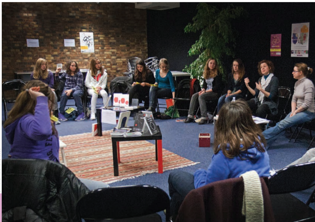
Plus de trente jeunes du club de lecture Lékri Dézados ont participé au café-culture dans la salle Boris-Vian de la bibliothèque Robert-Desnos, samedi 11 février. Au programme : la place de la culture à Montreuil.

Une trentaine d'ados du club de lecture Lékri Dézados s'est réunie pour un café-culture à la bibliothèque Robert-Desnos dans le cadre des Assises de la culture, samedi 11 février. Au programme pour ces jeunes âgés de 12 à 17 ans : un échange autour de ce qu'ils souhaitent voir à Montreuil. Découffant.