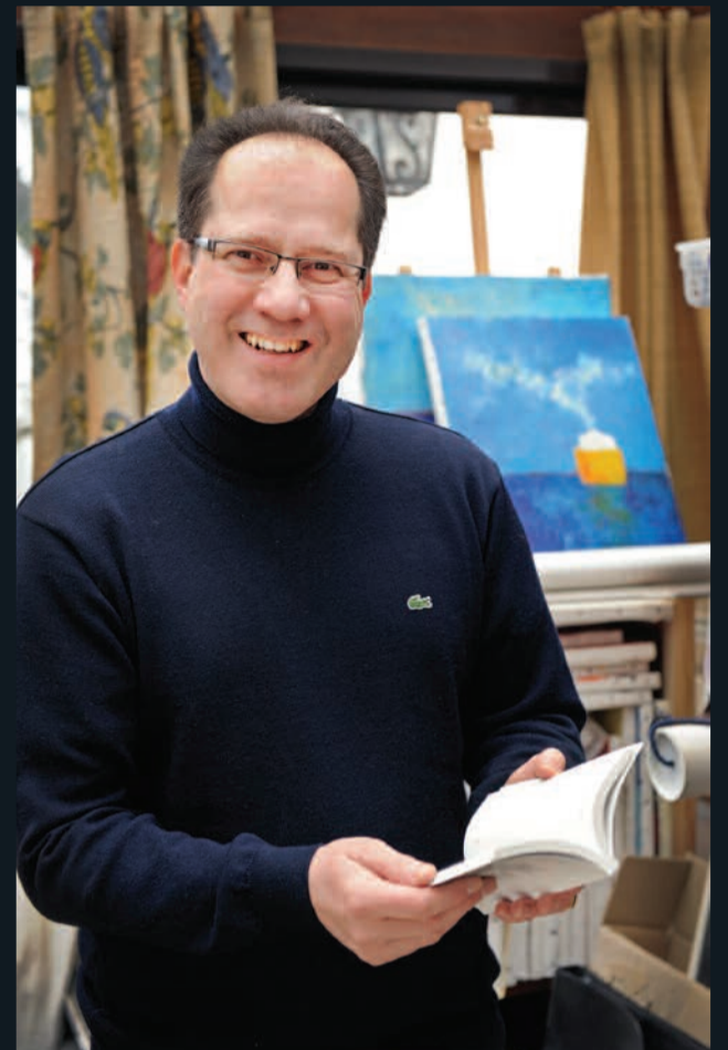
tête de l'art