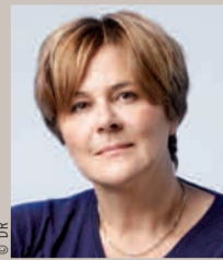
Dominique Voynet Maire de Montreuil

C' est une réalité triviale : nous produisons toujours plus de déchets, de toute nature... Déchets ménagers, déchets verts, déchets hospitaliers, déchets des entreprises, déchets « spéciaux »... Des déchets dont la prise en charge et le traitement pèsent lourd, sur le budget des particuliers, qui règlent la taxe d'enlèvement des ordures ménagères, des entreprises, des collectivités.