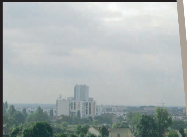
Montreuil-sous-Bois, de Marc Pichelin et Jean-Léon Pallandre.