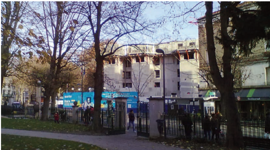
Les travaux du quartier centre-ville vus par une habitante.

Centre-Ville Le prochain rendez-vous du conseil de quartier aura lieu le mardi 27 mars, ouvert à tous-toutes les Montreuillois-e-s qui souhaitent exprimer leur point de vue sur la vie de leur quartier.