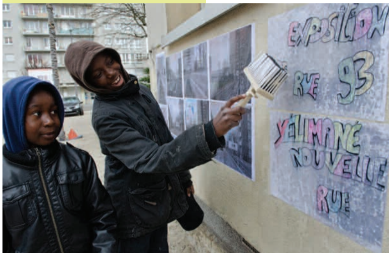
Des jeunes habitants du quartier affichent leurs dessins sur le PRUS.

mis à démolition. Leurs croquis témoignent de leur quotidien de citoyens : des panneaux publicitaires, des panneaux solaires, quelques arbres rabougris, la tour Eiffel, visible par endroits de ce quartier populaire construit sur les hauteurs de la ville. L'exposition de leurs dessins s'inscrit dans le cadre des « samedis du Prus », une initiative lancée par l'antenne vie de quartier qui veut donner rendez-vous aux habitants de Bel-Air - Grands-Pêchers chaque deuxième samedi du mois pour faire le point sur le projet de rénovation urbaine sociale. « Une fois par mois, nous voulons ouvrir une permanence hors