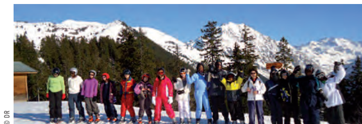
Les élèves du collège Mai-et-Georges-Politzer sous le soleil d'Allevard.

Samedi 5 mai, Halle du marché Croix-de-Chavaux de 9 à 18 heures. Inscriptions : salle Jean-Lurçat (entrée côté restaurant), 5, place du marché, le vendredi 13 avril de 18 h 30 à 20 heures, les samedis 21 et 28 avril de 17 heures à 19 heures et le dimanche 29 avril de 10 h 30 à 13 heures. Tél. : 06 15 15 71 46, mail : videgrenier2012@laposte.net. Tarif : pour 2 mètres 8 euros (associations) et 10 euros (particuliers).