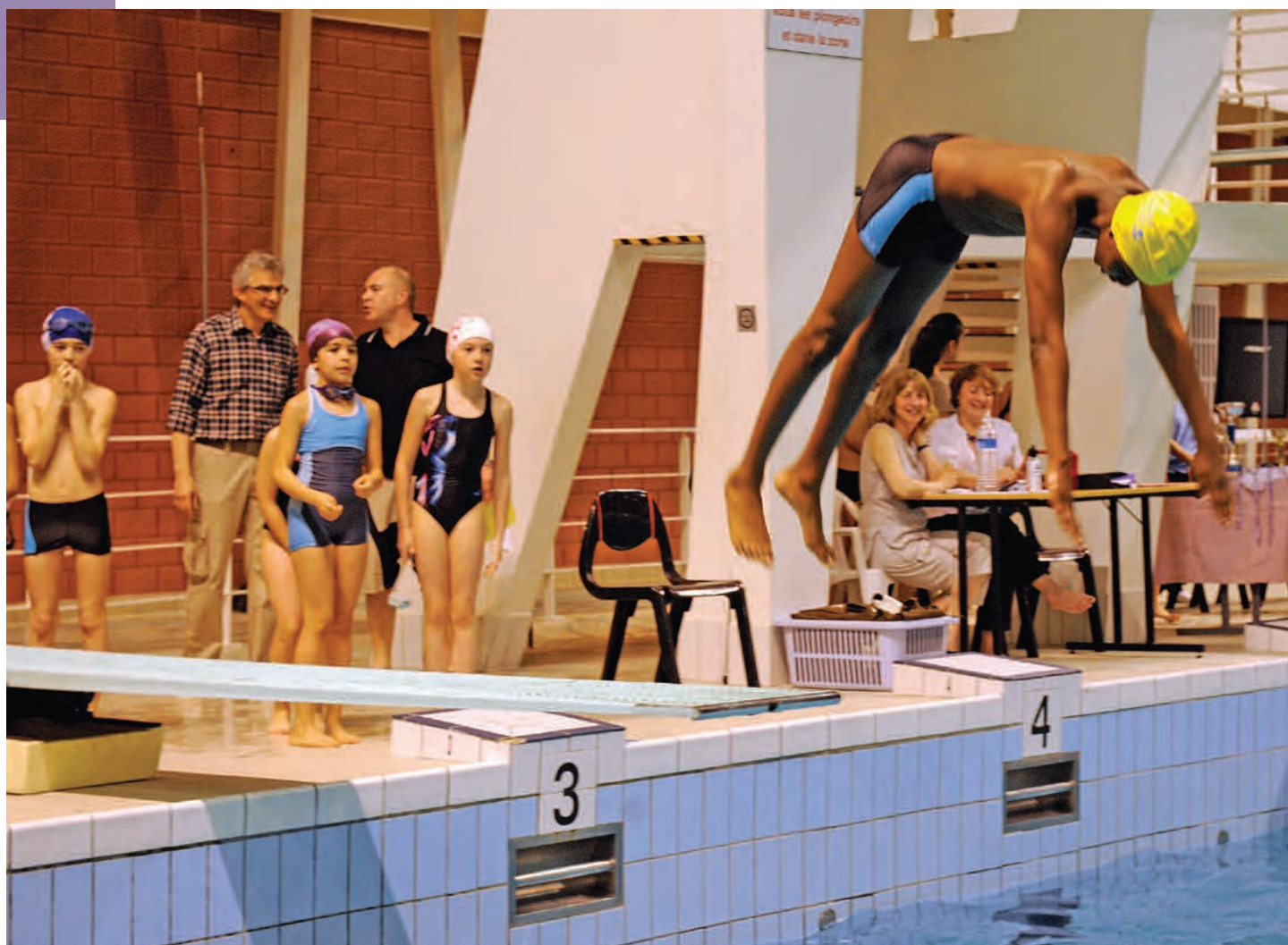
L'épreuve de plongeon (1 mètre).