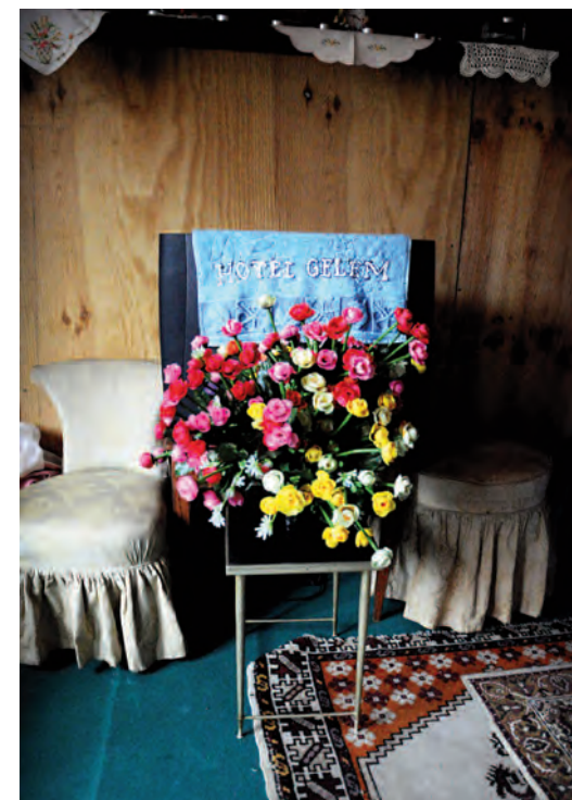
Fleurs, serviettes brodées: Alex et Rada ont à cœur de bien accueillir les voyageurs qui ont fait le chemin jusqu'à eux.