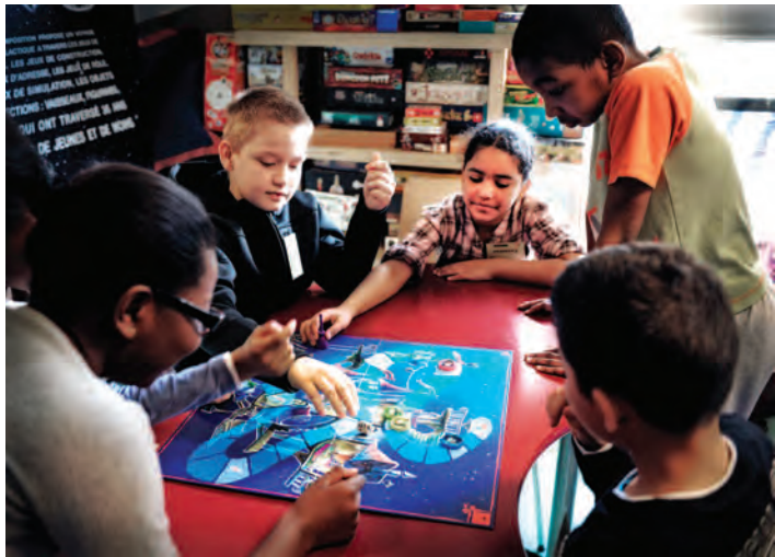
Les élèves de CM1 de Joliot-Curie 2 à la ludothèque 1, 2, 3 Soleil.

Du 12 au 16 mars, les élèves de CM1 de François Delhommeau à Joliot-Curie 2 ont troqué cahiers et stylos contre des mémos et dominos, pupitres et chaises contre les tapis de la ludothèque 1, 2, 3 Soleil. Précisons qu'ils y sont presque chez eux. En effet, depuis plus d'un an, les CM2 bénéficient d'un partenariat intergénérationnel sur le thème du jeu avec le Centre communal d'action sociale (CCAS). À ce titre, ils ont participé à des ateliers jeux avec les seniors une demi-douzaine de fois l'an dernier. Ils ont bénéficié d'un programme sur mesure à l'occasion de leur