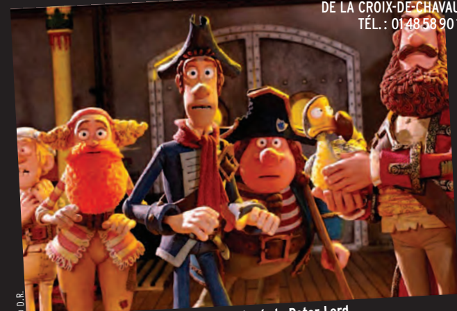
Les Pirates! Bons à rien, Mauvais en tout, de Peter Lord.

CINÉMA MUNICIPAL GEORGES-MÉLIÈS, CENTRE COMMERCIAL DE LA CROIX-DE-CHAUX TÉL.: 01 48 58 90 13