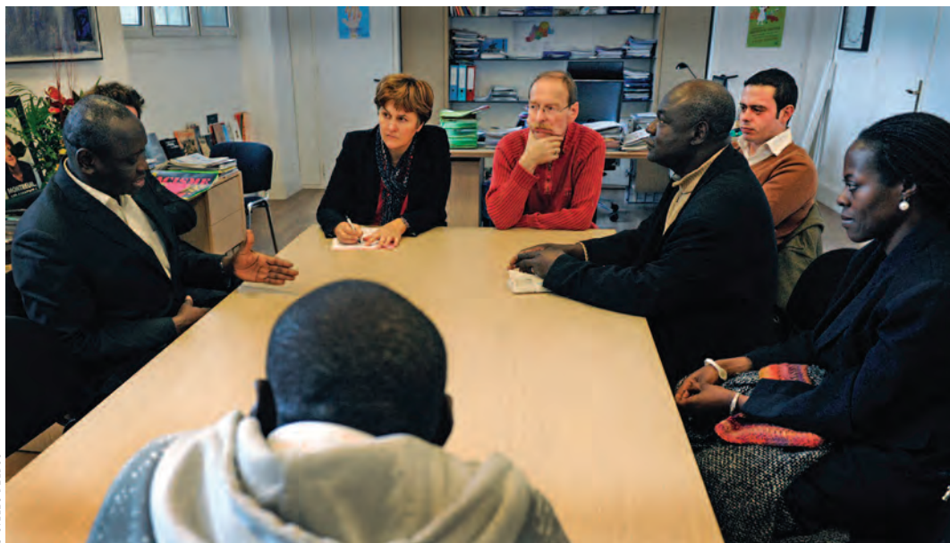
Des représentants de la communauté malienne discutent avec la Maire, des conseillers municipaux et des élus locaux.

L'inquiétude, mais surtout l'incertitude, se lit sur tous les visages. La Maire propose une