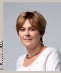
Dominique Voynet Maire de Montreuil

L es Montreuillois auront sans doute aperçu cette affiche sur les murs de la ville, qui plaide, au nom d'un parti que je ne citerai pas - élections obligent - pour la construction de 50 000 logements sociaux chaque année en Île-de-France. On peut discuter du chiffre, un peu plus, un peu moins, pas de la réalité des besoins, pas de leur ampleur, pas de l'urgence.