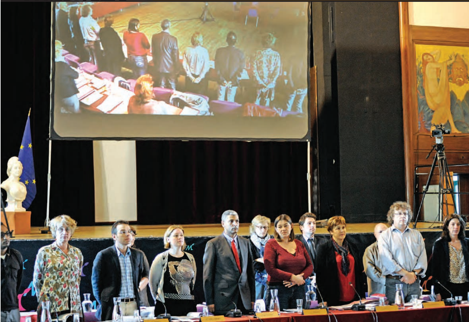
Le samedi 24 mars, lors du conseil municipal, l'ensemble des élu-e-s ont observé une minute de silence en hommage aux victimes des assassinats de Toulouse et Montauban.