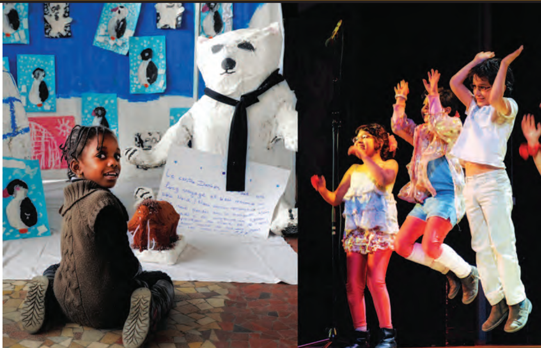
Créations plastiques (à gauche) et expression scénique : c'est ça le Festival de l'enfance !

Créations plastiques, courts métrages, créations scéniques et spectacle de danse, à chaque mercredi son thème pour la première édition du Festival de l'enfance, qui se tenait du 7 au 28 mars. Un Festival de l'enfance qui fait une fois de plus la démonstration qu'animateurs et enfants ont vraiment du talent.