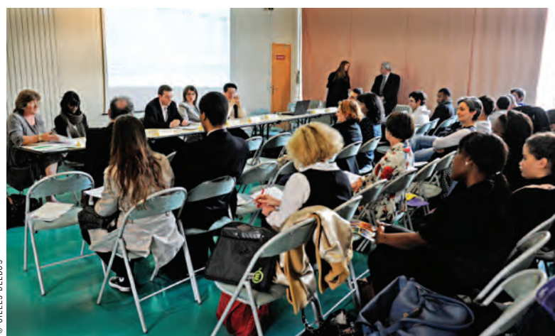
Une table ronde au lycée Condorcet pour promouvoir certaines filières auprès des filles.

« Notre établissement propose des filières à la suite desquelles les élèves diplômés sont assurés d'une carrière réussie dans