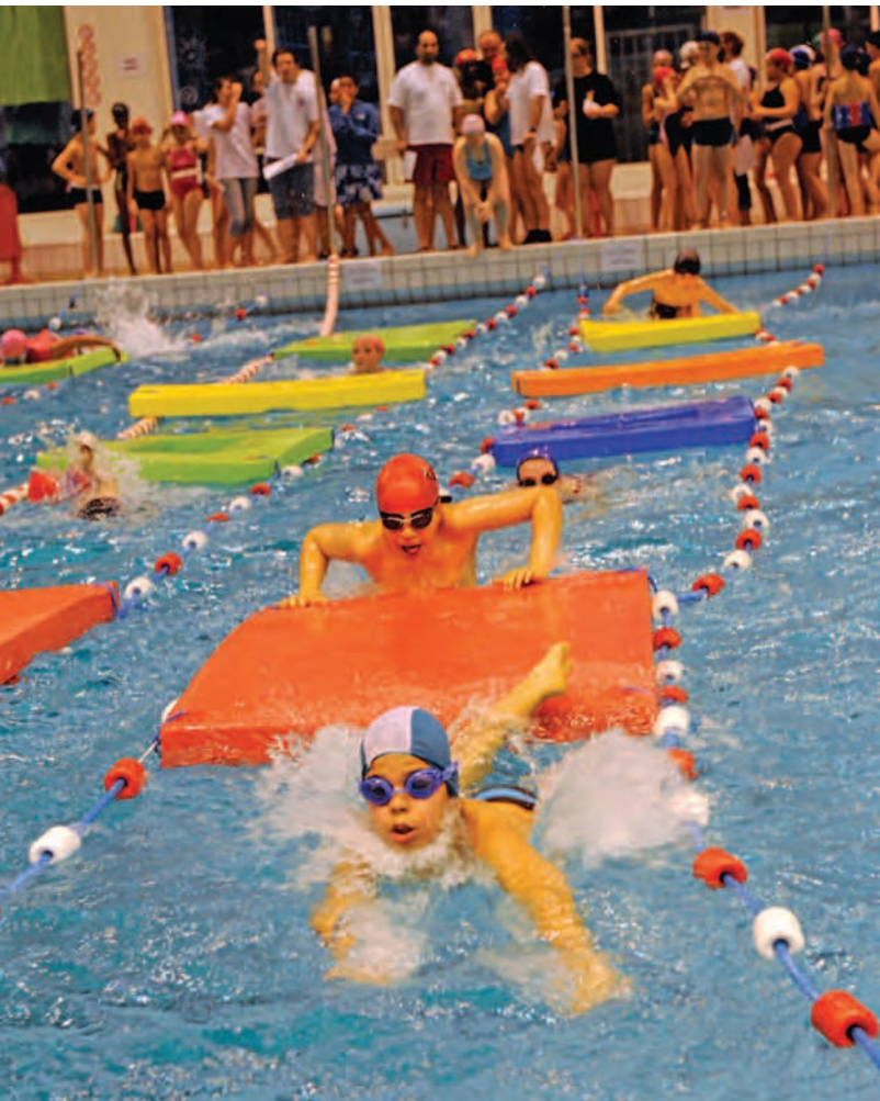
La grande traversée, une course d'obstacles nautique.