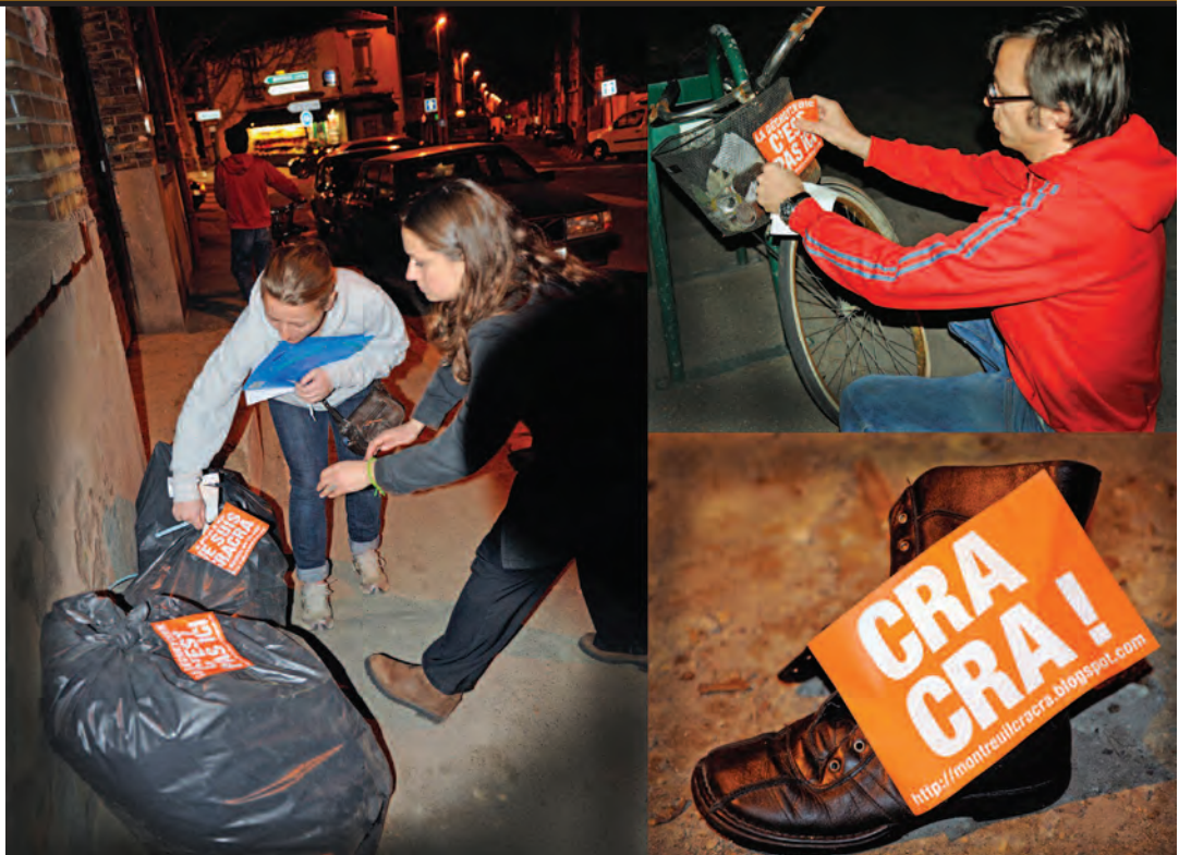
Le 23 mars, des habitant-e-s en pleine « cracrAction ».