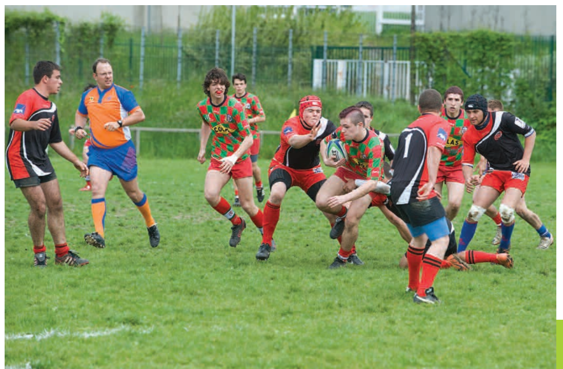
En demi-finales, le RC montreuillois a battu Tournus-Cluny 10 à 5 et l'Entente sportive Nanterre 18 à 10.

Fête du RC montreuillois, le 2 juin à partir de 11 heures au stade Robert-Barran.