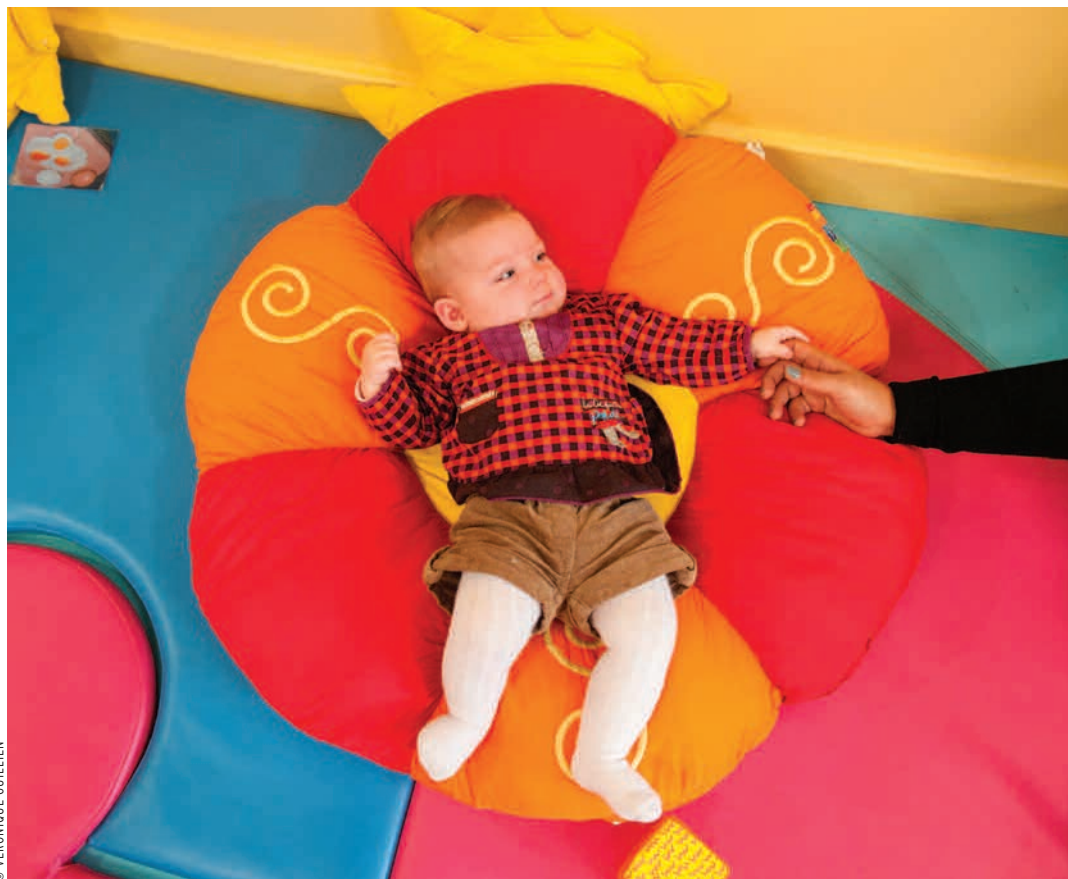
Au relais petite enfance Pauline-Kergomard.

En résumé, le 2 juin, les parents sauront comment se procurer la