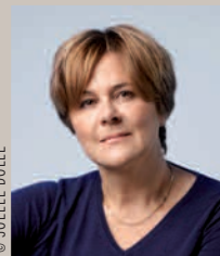
Dominique Voynet Maire de Montreuil

À Montreuil en tout cas, on se souviendra de ce drôle d'hiver 2011-2012, qui mit si longtemps à arriver, au point que certaines plantes se laissèrent prendre au piège et bourgeonnèrent fin janvier, pour s'éterniser ensuite, de la vague de froid exceptionnelle de février aux pluies diluviennes de mai. Du vent, du froid, du gris, épuisants pour le corps, minants pour le moral, douchant à tous les sens du terme les efforts des organisateurs des premières