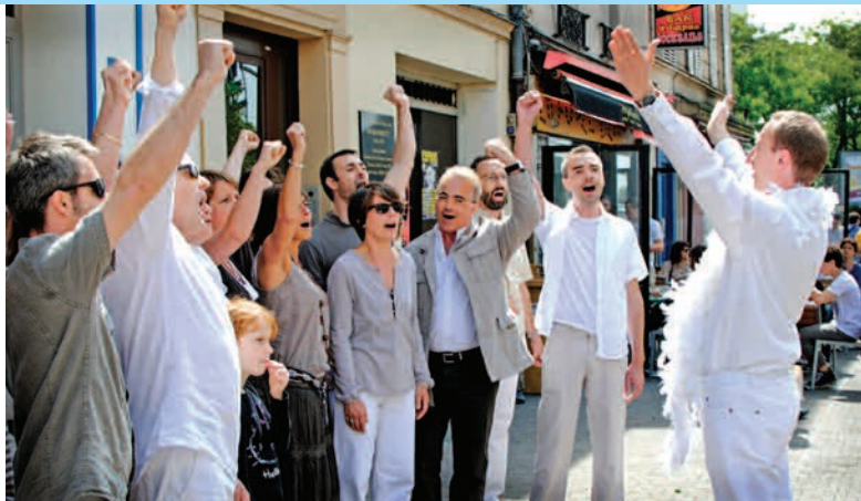
La chorale Les Agités du vocal lors de Montreuil-sous-Voix 2011.

✕ mercredi 6 juin à 20 h 30, antenne vie de quartier, 35 bis, rue Gaston-Lauriau.