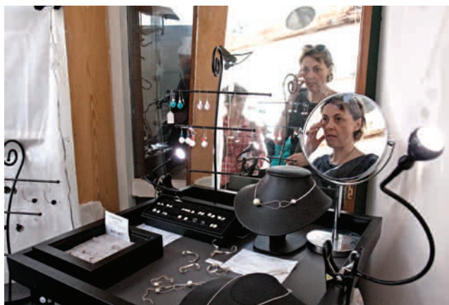
LA FOVÉA

■ C'est en suivant les sillons mauves tracés dans tout le Bas-Montreuil par le graffeur Artof Popov que le public a pu, les 12 et 13 mai, découvrir les créations de trente-trois artistes et artisans lors des Manufactories, quatrième édition de portes ouvertes d'une dizaine d'ateliers installés autour de la place de la République.