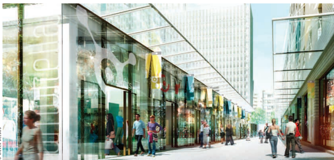
La future promenade commerçante du Quartier de la mairie, dont les travaux avancent à grands pas.

Le 10 octobre prochain, les trente-deux enseignes de Grand-Angle, la future rue commerciale du Quartier de la mairie, ouvriront leurs portes et créeront près de 200 emplois. Pour que ces postes soient pourvus par des Montreuillois-es, la Ville vient de créer une plate-forme de recrutement local.