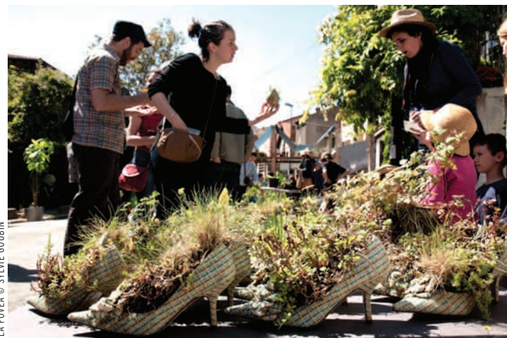
LA FOVÉA

■ Dimanche 13 mai, la treizième édition du troc vert organisée par l'association les Buttes à Morel a attiré rue Maingnet les jardiniers de Montreuil et de nombreuses villes alentour pour échanger des plantes, des graines et des conseils sur la façon de s'en occuper. • www.trocvert.fr