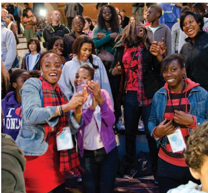
Le public enthousiaste