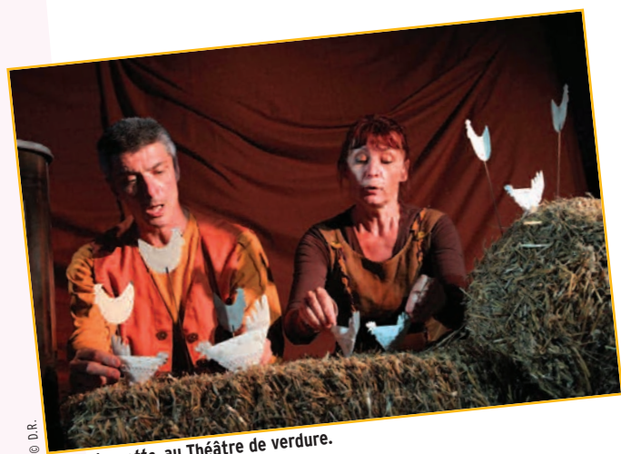
Cocoricocotte, au Théâtre de verdure.

TOUS MONTREUIL N°77 DU 29 MAI AU 11 JUIN 2012