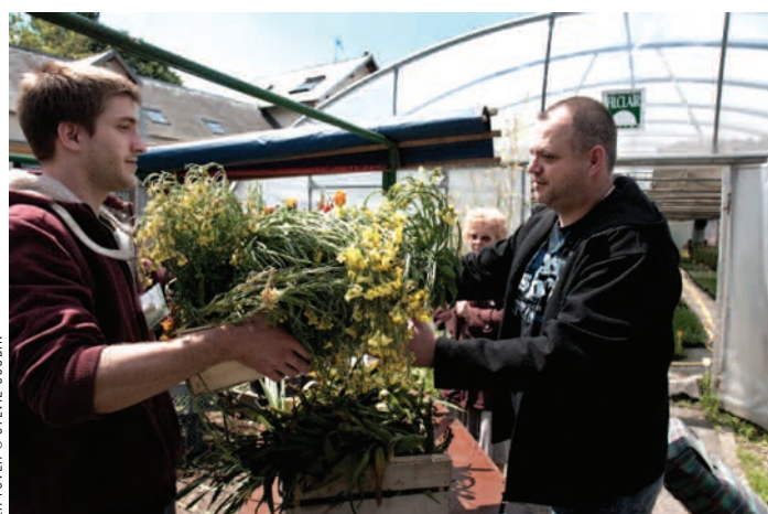
LA FOVÉA © SYLVIE GOUBIN