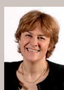
Dominique Voynet Maire de Montreuil Sénatrice de Seine-Saint-Denis

Q u'y avait-il donc de si urgent qui justifie une énième réforme de l'hôpital ? « Il faut un seul patron à l'hôpital public », a martelé Nicolas