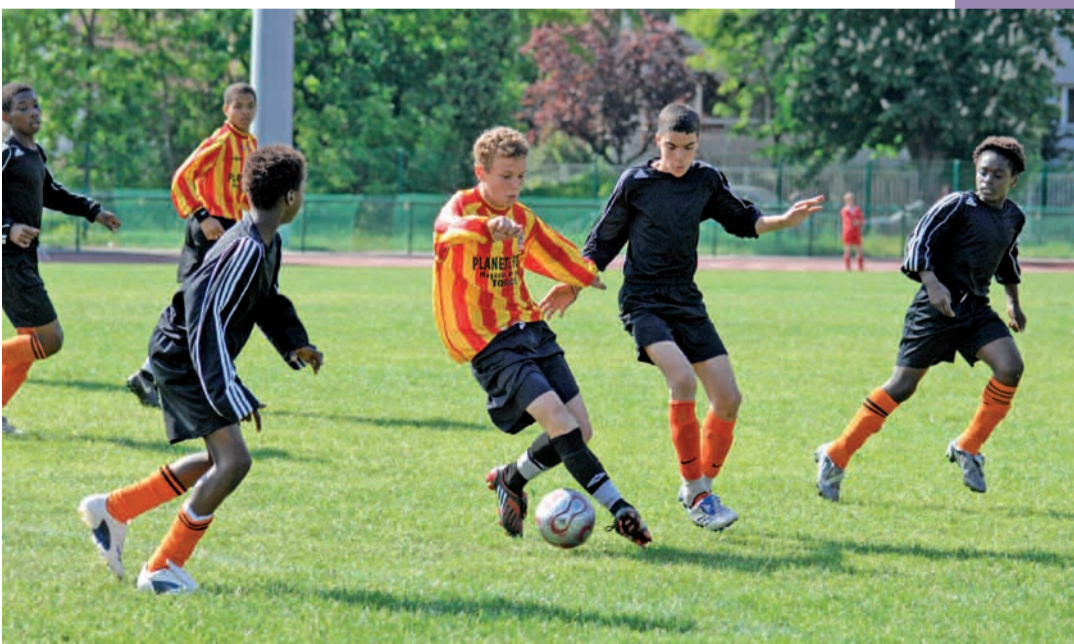
Lors du Tournoi international de la Pentecôte 2008.

✘ SAVOIR PLUS : Complexe sportif des Grands-Pêcheurs : les 30, 31 mai et le 1 er juin, entrée libre. Début des rencontres à 13 heures le samedi et 11 h 30 les deux autres jours. Les équipes : poule 1 : US Torcy, CSL Aulnay, ESD Montreuil, Mladost Mesorina (Serbie) ; poule 2 : SC Fribourg (Allemagne), Jeunesse Aubervilliers, RSC Montreuil, FC Yalta (Ukraine) ; poule 3 : JA Drancy, RUSA Schaerbeek (Belgique), US Roye ( la Somme), FC Montfermeil, FSS Salaberry (Canada), FC Tremblay.