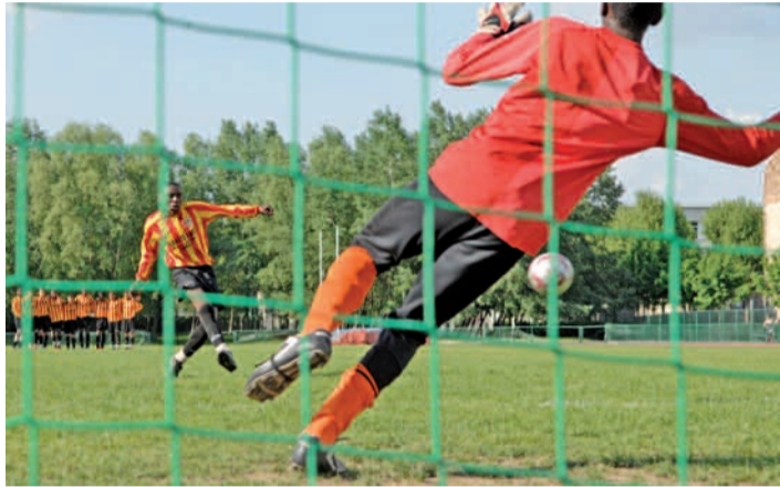
Lors du Tournoi international de la Pentecôte 2008.

D ire que le football est une religion à l'ESDM serait incontestablement une image païenne mais présenterait l'avantage de dire la passion qui tourne autour de cette discipline. Meilleur exemple, la Pentecôte est depuis trente-cinq ans maintenant le rendez-vous festif des amoureux du ballon rond au club. Trois jours complètement foot dédiés aux 13 ans, auxquels s'associent deux cents bénévoles, éducateurs, amis, familles de l'Élan sportif de Montreuil. L'ESDM ne peut se limiter à la seule pratique du football. Neuf sections coexistent : football, basket-ball féminin, badminton, judo, gymnastique, tennis de table, penchak sylvat (self-défense), danse moderne jazz et rassemblent près de 1 300 licenciés. Le football en compte toutefois cinq cents, une petite moitié ! Le Tournoi international de la Pentecôte est une énorme machine à plaisir qui mobilise les énergies et qui trouve son apothéose pendant les trois jours de rencontre sportive. Seize équipes de 13 ans, venues de l'étranger, de province se retrou-