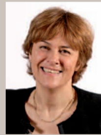
Dominique Voynet Maire de Montreuil Sénatrice de Seine-Saint-Denis

U n grand débat a agité le dernier conseil municipal : faut-il, ou non, relancer l'effort de construction de logements ?