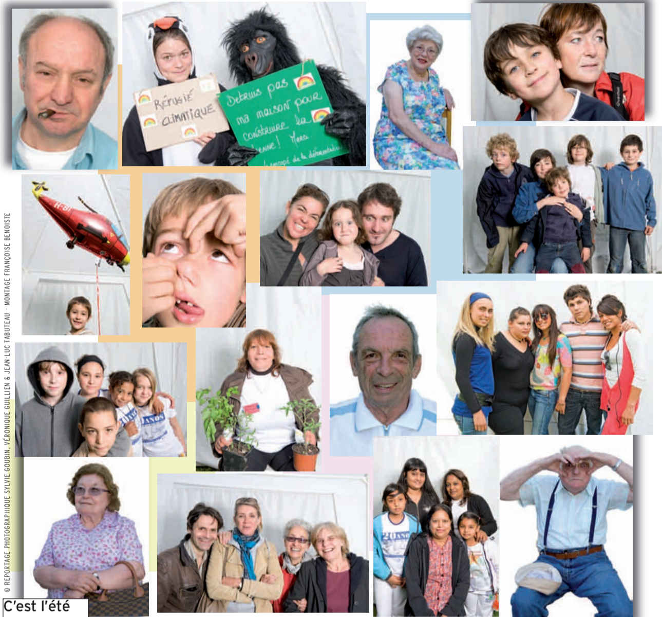
© REPORTAGE PHOTOGRAPHIQUE SYLVIE GOUBIN, VÉRONIQUE GUILLEN & JEAN-LUC TABUTEAU - MONTAGE FRANÇOISE BENOISTE

LE JOURNAL DE LA VILLE ET DE SES HABITANT-E-S