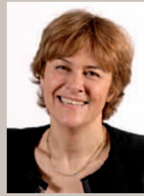
Dominique Voynet Maire de Montreuil Sénatrice de Seine-Saint-Denis

A près un été au cours duquel la fréquentation des séjours de vacances et des centres de loisirs a battu des records, au cours duquel les jardins, squares et équipements sportifs – piscine, gymnases, parcabout... – ont été pris d'assaut, c'était la rentrée cette semaine pour des milliers de jeunes Montreuillois, et pour leurs parents, pour lesquels c'est toujours un moment au goût particulier, mélange de joie, d'excitation et d'inquiétude... Je peux aujourd'hui l'affirmer, elle s'est bien passée.