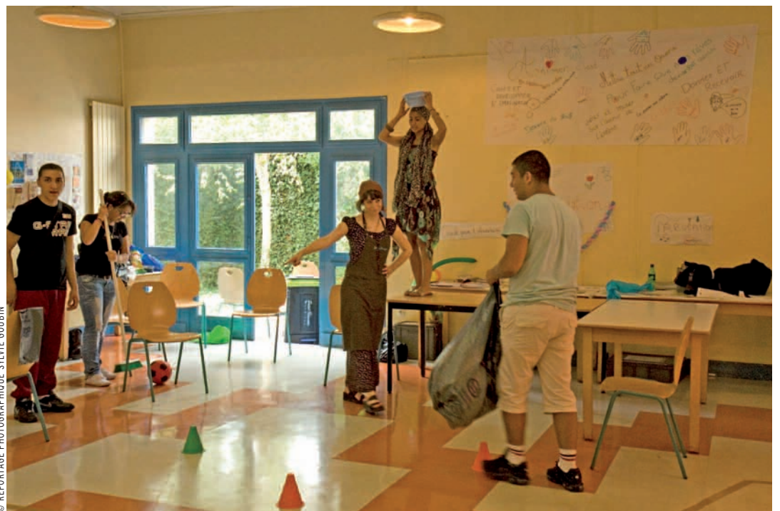
Outre l'apprentissage théorique, les bénéficiaires de la formation Bafa ont été initiés à des jeux de rôle, d'adresse, de société...

Telle est l'énigme à résoudre par les bénéficiaires de la formation Bafa. Ce jeu de Cluedo, dont l'expa-pe de la pop est le fil rouge, fait partie de la session de formation pour devenir animateur. Il sert à souder le groupe. Mais bien d'autres activités sont testées durant cette semaine. Elles permettront aux futurs animateurs de s'en inspirer une fois le Bafa en