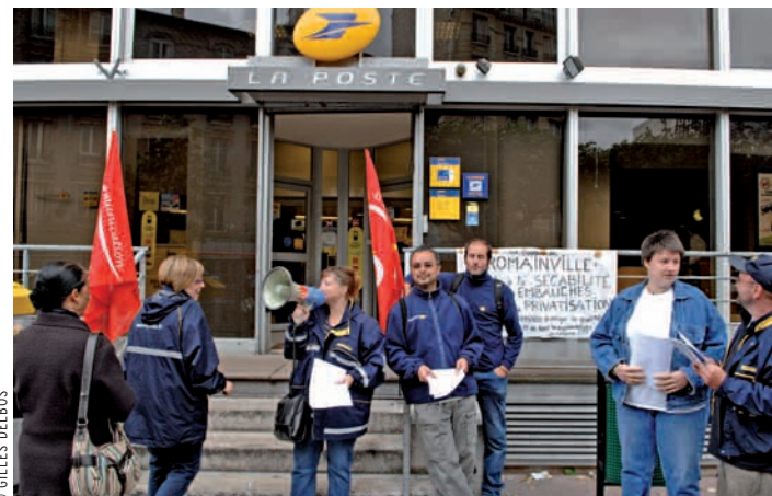
Le 22 septembre, un mouvement social est également prévu à La Poste pour protester contre sa possible privatisation.

qui abandonnent leur caractère public, augmentent les prix, licencient ou ferment des bureaux pour cause de rentabilité, comme en témoignent les exemples de France Télécom ou des Autoroutes. Le référendum d'initiative populaire inscrit dans la constitution depuis l'été 2008 peut être organisé si un dixième des électeurs inscrits le réclament, et 20 % des parlementaires. D'où l'importance de