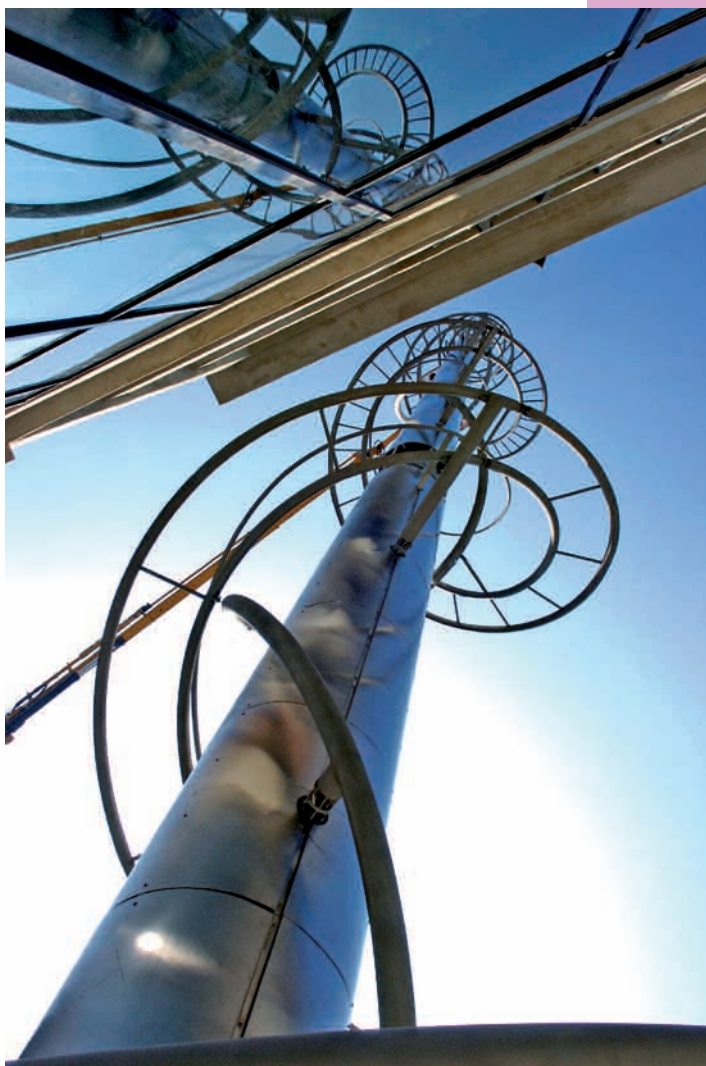
L'Asymptote, créée par l'artiste Antoine Pétel, fait référence au passé industriel du Bas-Montreuil. Visite guidée.

Créées en 1984, par le ministère de la Culture, les Journées portes ouvertes des monuments historiques sont suivies l'année d'après dans de nombreux pays. Quand l'Union européenne s'associe à cette initiative, l'événement se transforme en Journées européennes du patrimoine et a désormais lieu chaque année le troisième week-end de septembre. Ces journées témoignent de l'intérêt des citoyens pour l'histoire des lieux et l'histoire de l'art. Parallèlement aux chefs-d'œuvre de l'architecture civile ou religieuse, les sites naturels comme les parcs et les jardins, les patrimoines industriels et agricoles sont également mis à l'honneur. En liaison avec la Commission européenne et à l'issue des Rencontres pour l'Europe de la culture, le label « patrimoine européen » a pour objectif de mettre en valeur des lieux de mémoire favorisant notre sentiment d'appartenance à un espace culturel commun. Aujourd'hui, 49 pays célèbrent le patrimoine culturel européen.