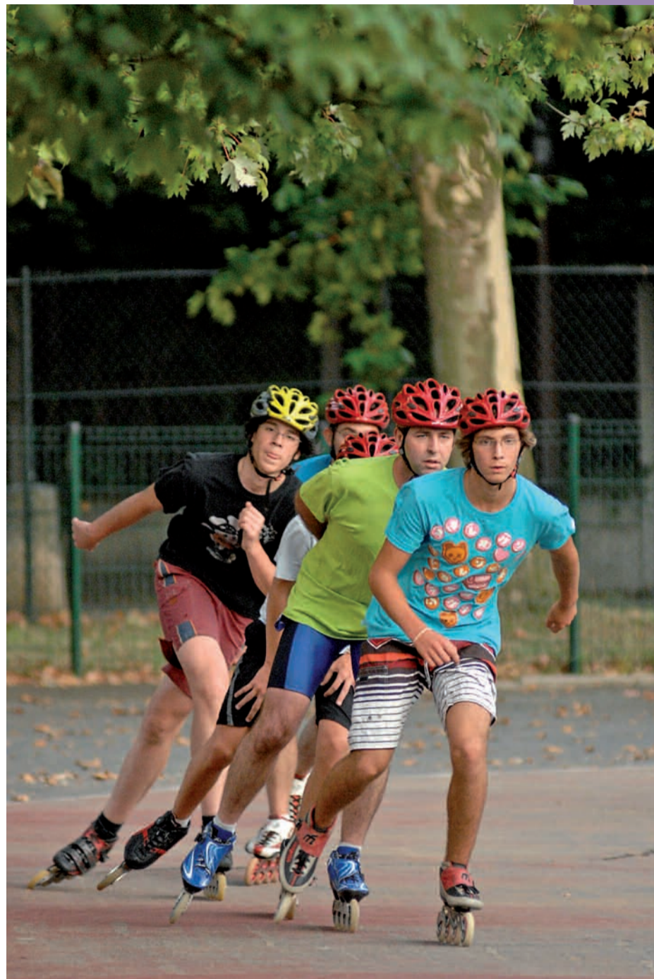
La course et la randonnée sont des disciplines qui allient technique de glisse et endurance.

Le club a mis en place une école de patinage qui permet aux débutants d'apprendre les rudi-