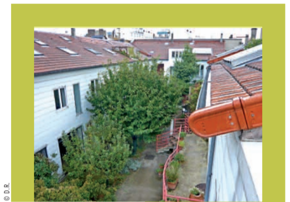
LA BELLE IDÉE

De l'habitat groupé à l'écoquartier. PAGE 21