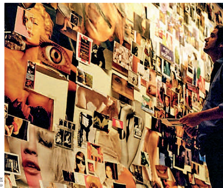
Photogramme extrait de La Domination masculine de Patrick Jean.

Nous considérons que les préférences sexuelles doivent rester un choix privé et qu'aucun droit ne saurait être nié à une personne