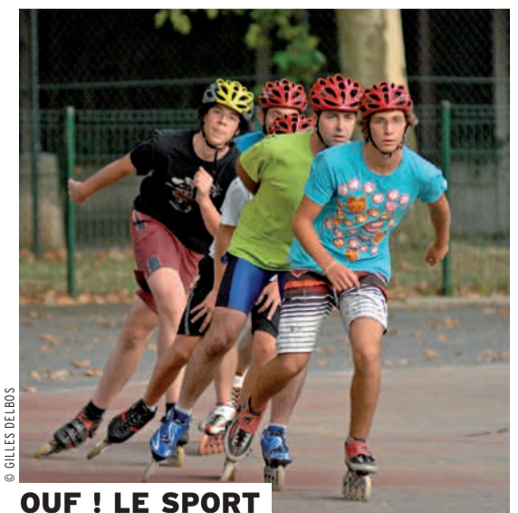
OUF ! LE SPORT

Avec trois associations pour le maintien d'une agriculture paysanne (AMAP), une association de système d'échange local, des coopératives, des Scop, une régie de quartier et de nombreux acteurs engagés, Montreuil est un vivier de l'économie sociale et solidaire. PAGES 15 À 18, 21