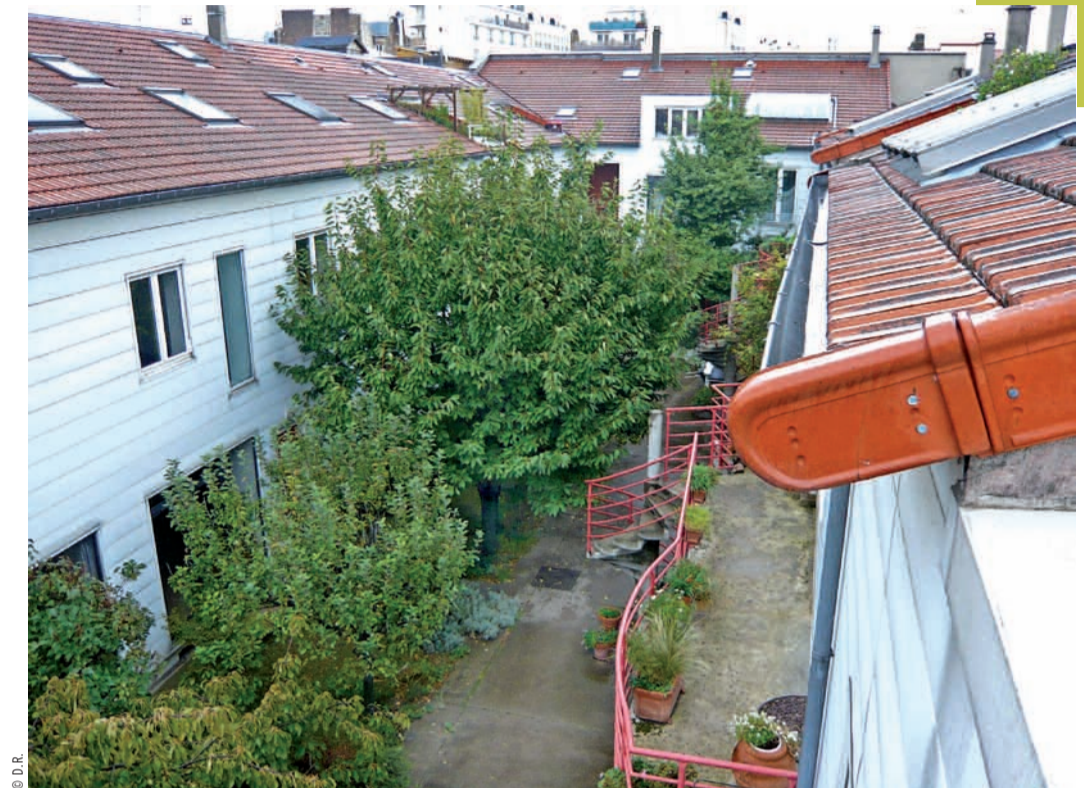
Un exemple d'habitat groupé autogéré : la copropriété Couleur d'Orange, créée en 1986 sur le site d'une usine désaffectée, rue Barbès, à Montreuil.

Les groupes d'habitat autogérés, constitués en moyenne de cinq à quinze familles, fédèrent des gens aux parcours militants syndicaux ou associatifs, porteurs d'une sociabilité collective. À la recherche d'une autonomie et d'un épanouissement individuel, ces collectifs interrogent la répartition des espaces privés et publics, l'articulation des temps et des lieux de vie, et les relations de la cellule familiale et de ces membres avec l'extérieur. « La plupart des groupes ont joué un rôle moteur pour désenclaver les quartiers et dynamiser les échanges à l'échelle locale, en revendiquant l'appropriation de leurs lieux de vie par les habitants. » C'est le cas de « Couleur d'orange », dans le Bas-Montreuil, qui ouvre ses espaces communs à la population extérieure avec des initiatives diverses : rencontres de parents d'élèves, fêtes de quar-