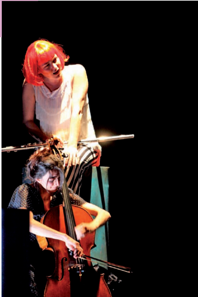
La musique s'écoute et se regarde lorsqu'elle rencontre les autres arts de la scène.

De la musique « fraîche ». Voilà ce que souhaite nous offrir le conservatoire à partir du 15 novembre avec le festival Le Temps fort. Des concerts où l'improvisation, l'invention et la création renouvellent la musique en scène. Une polyphonie visuelle et sonore avec théâtre, danse et vidéo.