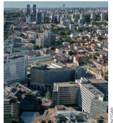
CARREFOUR. Un des rares centres commerciaux où j'allais dans les années 1990. 235, rue Étienne-Marcel.