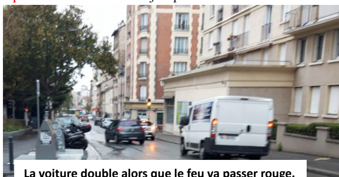
La voiture double alors que le feu va passer rouge.

- Niveau du 72 les ambulanciers se garent et restent au niveau de la grille, les voitures de la résidence ne peuvent plus sortir, conflits avec kiné.