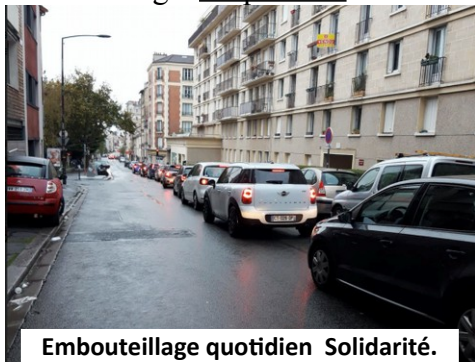
Embouteillage quotidien Solidarité.

- Depuis Fontenay à Parapluies : la rue est en pente vitesse excessive , matin et soir circulation et embouteillage. Proposition : demande de plusieurs rehausseurs jusqu'au croisement avec Bld Jeanne d'Arc.