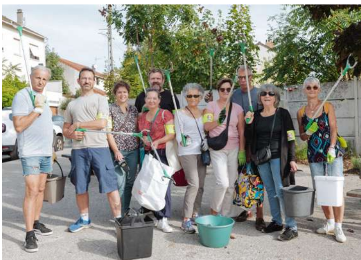
JULIETTE DE SIERRA

Elle a des allures de place du village, avec ses petits commerces de quartier, ses bancs qui se font face, sa boîte à partage et les aménagements piétons qui la rendent si pittoresque. Cette jolie place de la Paix, la riveraine Pascale Geib y est de plus en plus attachée. Depuis un an, elle participe à la chasse à la ramasse chaque premier samedi du mois, et redécouvre ainsi son quartier tout en rencontrant de « belles personnes ». « Les nouveaux habitants d'un immeuble neuf se sont joints à nous », raconte-t-elle.