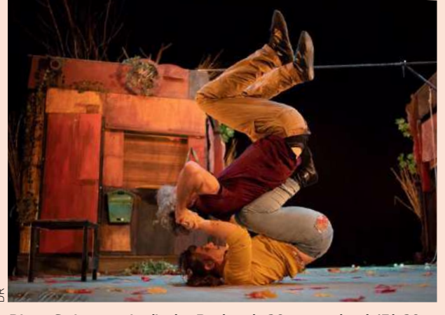
DistanS, cirque au jardin des Roches, le 30 septembre à 15 h 30.