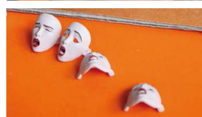
JULIETTE DE SIERRA