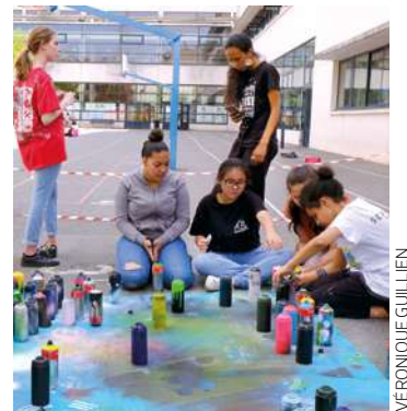
LE COLLÈGE PAUL-ÉLUARD. Un excellent établissement. Un de mes fils y a effectué sa scolarité. 16, rue Raspail.

L'ÉGLISE SAINT-ANDRÉ. Je vais dans cette église tous les dimanches. Il y a là une belle communauté. 36, rue Robespierre.