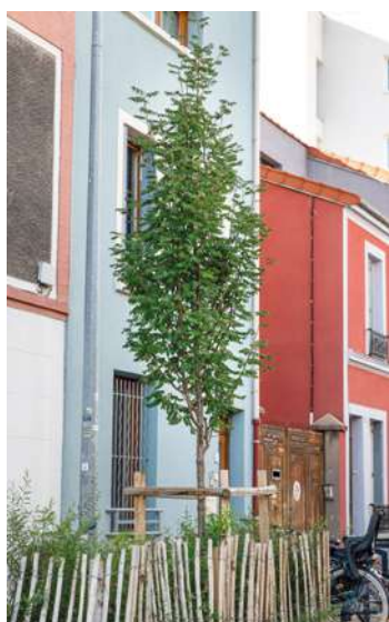
JULIETTE DE SIERRA

Grand succès pour la 5 e édition de la Grande Rando, dimanche 24 septembre. Organisée par Est Ensemble et le Comité de randonnée pédestre de la Seine-Saint-Denis, cette randonnée est une marche festive de plusieurs niveaux (13 km, 7 km et 3 km), qui suit le parcours du futur Grand Chemin, une boucle verte qui reliera les villes d'Est Ensemble, Fontenay-sous-Bois, Rosny-sous-Bois et Paris.