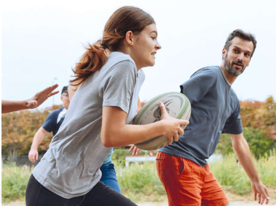
Des habitants s'adonnant sérieusement au touch rugby (qui interdit les chocs et les plaquages).

En ce dimanche matin grisâtre, le parc Montreuil est particulièrement animé. Sur la pumptrack, les aficionados de BMX et de trottinette enchaînent les tours. Sur la dalle en béton circulaire, les usagers de « Sport dans les parcs » profitent de leur séance hebdomadaire de kickboxing. Et sur les carrés de pelouse alentour, les amateurs de ballon ovale s'activent (nouveau dans cet espace vert). Des enfants, des adultes (femmes et hommes), pratiquants chevronnés ou néophytes, qui prennent part au dispositif « Rugby dans les parcs » organisé conjointement par le Rugby club montreuillois (RCM) et la Ville trois dimanches de suite dans les trois parcs de Montreuil de 10 h à 12 h (la dernière séance aura lieu aux Beaumonts le 1 er octobre). « L'idée est de profiter de l'élan