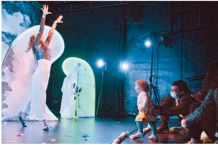
Spectacle pour les tout-petits au Théâtre des Roches.