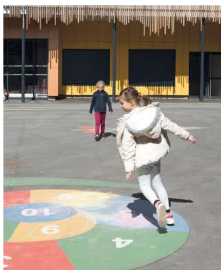
Dans la cour de l'école Marceau.

– Pour les mercredis, la réservation est ouverte pour toute l'année. Elle doit