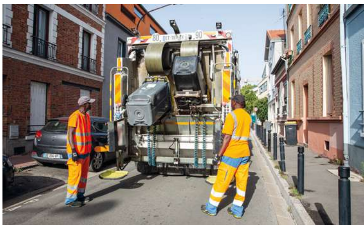
La collecte des déchets recyclables (poubelle jaune).

Le marché de collecte des déchets arrivait à échéance et Est Ensemble, en charge des déchets sur le territoire, a modifié la donne. Objectif : réduire les coûts financiers (le traitement