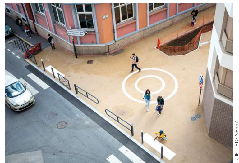
JULIETTE DE SIERRA

piétonnes. Quelque 120 m 2 d'espaces verts vont faciliter le drainage des eaux de pluie. Le parvis de 500 m 2 est pourvu de marquages ludiques, et une couleur claire pour le sol contribue à lutter contre les îlots de chaleur. « Ce type d'aménagement favorise l'écomobilité scolaire et le lien social », rappelle Olivier Stern, élu aux mobilités et à la ville cyclable. L'opération, chiffrée à 120 000 € et financée par la municipalité, devrait s'élargir à d'autres écoles d'ici la rentrée prochaine. ■