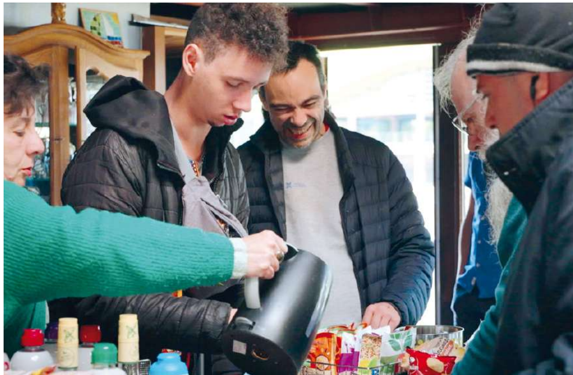
Image extraite du film de Nicolas Philibert Sur l'Adamant , consacré à un centre de jour flottant sur la Seine.