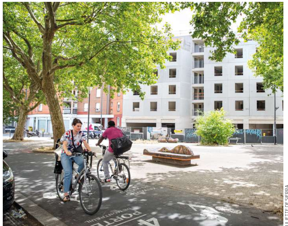
PLACE DE LA FRATERNITÉ. Je passe souvent par là pour aller à l'église ou pour accéder à d'autres commerces.