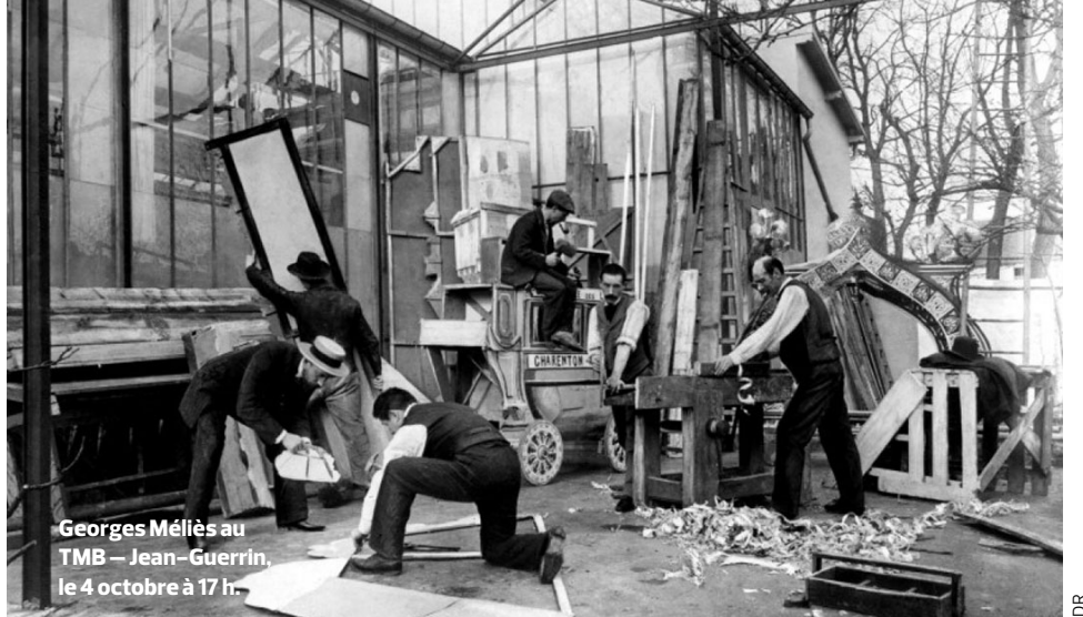
Georges Méliès au TMB – Jean-Guerrin, le 4 octobre à 17 h.