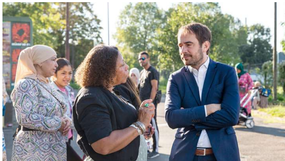
Le maire à la rencontre des Montreuillois.

La rentrée est aussi l'occasion de mentionner nos projets de « Rues aux écoles », ces rues piétonnes qui doivent permettre de sécuriser les trajets des