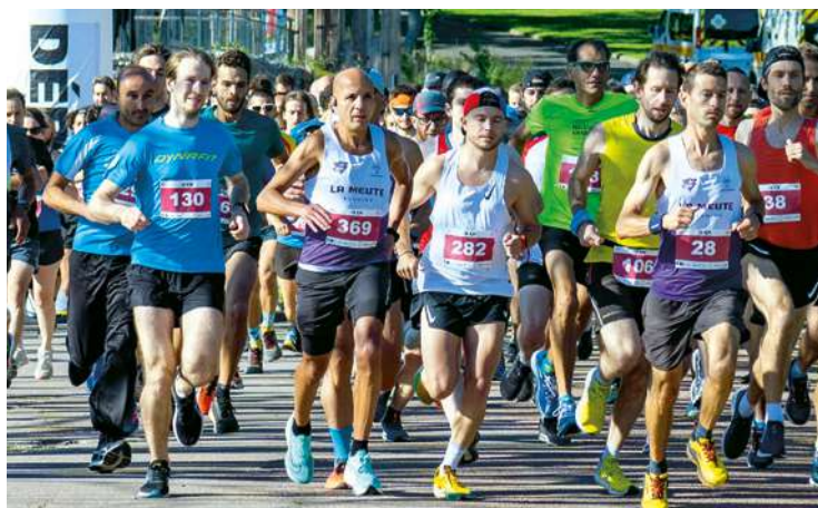
La course traverse neuf communes, et mêle ville et nature.

Elle avait été reportée en raison des violences urbaines qui ont émaillé le territoire français au début de l'été. La seconde édition du trail des Hauteurs aura finalement lieu le 15 octobre. Organisée par la FSGT 93, avec le soutien d'Est Ensemble, du Comité départemental olympique et sportif (CDOS) 93 et de l'île de