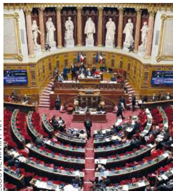
348 sénateurs siègent.

Ce dimanche 24 septembre ont eu lieu les élections sénatoriales. Exception dans le paysage institutionnel français, le Sénat est renouvelé au suffrage universel indirect et seulement par moitié tous les trois ans. Les six sénateurs de Seine-Saint-Denis faisaient partie de cette moitié renouvelable. Les trois sortants qui se représentaient ont été réélus : Fabien Gay (PCF), qui est aussi le directeur de la rédaction de L'Humanité , Vincent Capo-Canellas (UDI)