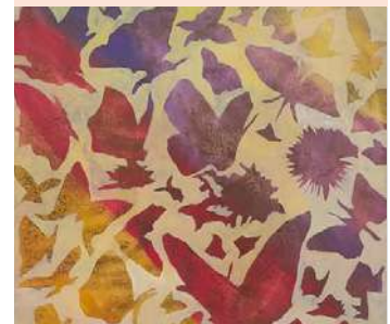
JOSÉE LE ROUX

Des papillons rose, rouges et violets accueilleront bientôt les écoliers de l'élémentaire Nanteuil. Une journée dans la vie d'un papillon, de l'aube au crépuscule, œuvre de 18 mètres en 12 tableaux, sera installée pendant les vacances de la Toussaint.