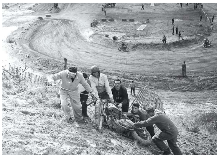
Une épreuve de motocross internationale aux Buttes à Morel en 1956.

Grâce aux témoignages d'une dizaine d'habitants, l'association Passerelle de mémoire a réalisé La Noüe, Le Clos-Français , un documentaire retraçant l'histoire de ce quartier. Rendez-vous le 6 octobre à 14 h au Méliès pour la projection.