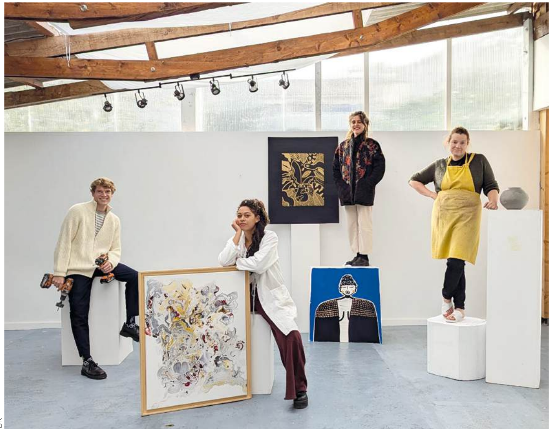
Ancien garage reconverti en atelier-galerie, Âme nue héberge six artistes, rue du Midi.

De loin en loin, à travers toute la ville, des ballons de baudruche signaleront, comme d'habitude, tous les ateliers qui ouvrent leurs portes. Ce week-end-là, chacun pourra trouver le chemin de l'art. ■ Jean-François Monthel