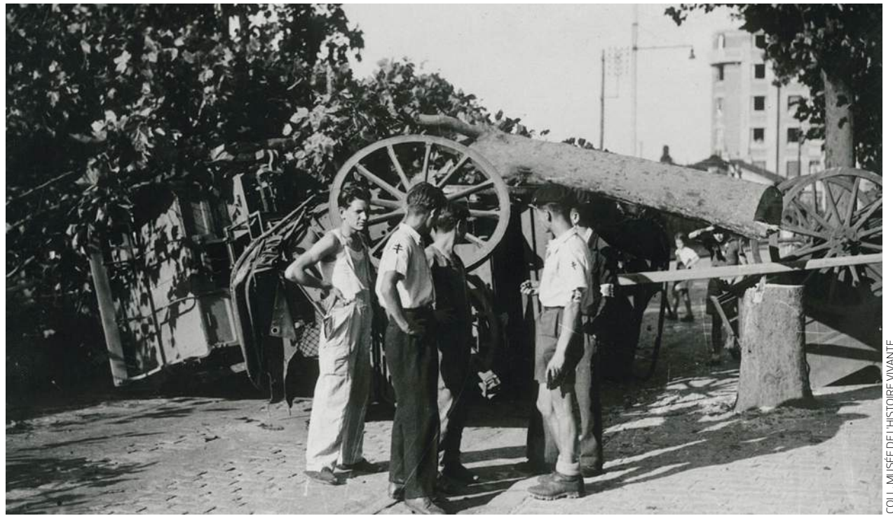
Le 19 août 1944, la ville de Montreuil se hérissé de barricades.