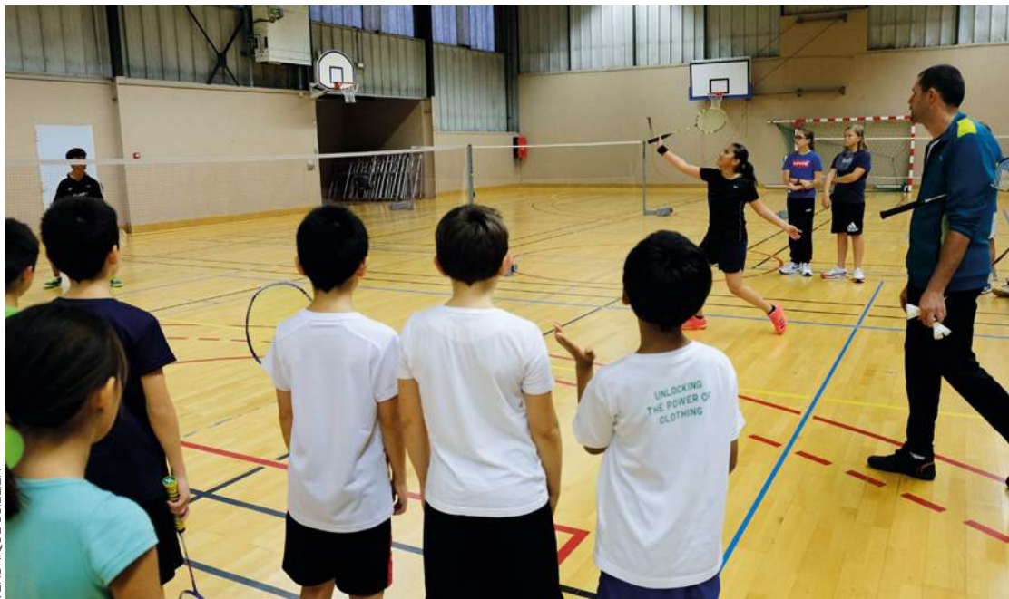
Le badminton, un des sports où la mixité règne, est l'activité sportive numéro 1 en milieu scolaire.

«C'est le jeu d'échecs le plus physique au monde»