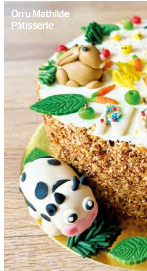
Orru Mathilde Pâtisserie