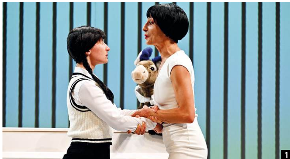
Peau d'âne – la fête est finie au TPM.

La songwriter française est de retour avec sa jolie pop or-