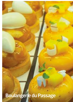
Boulangerie du Passage