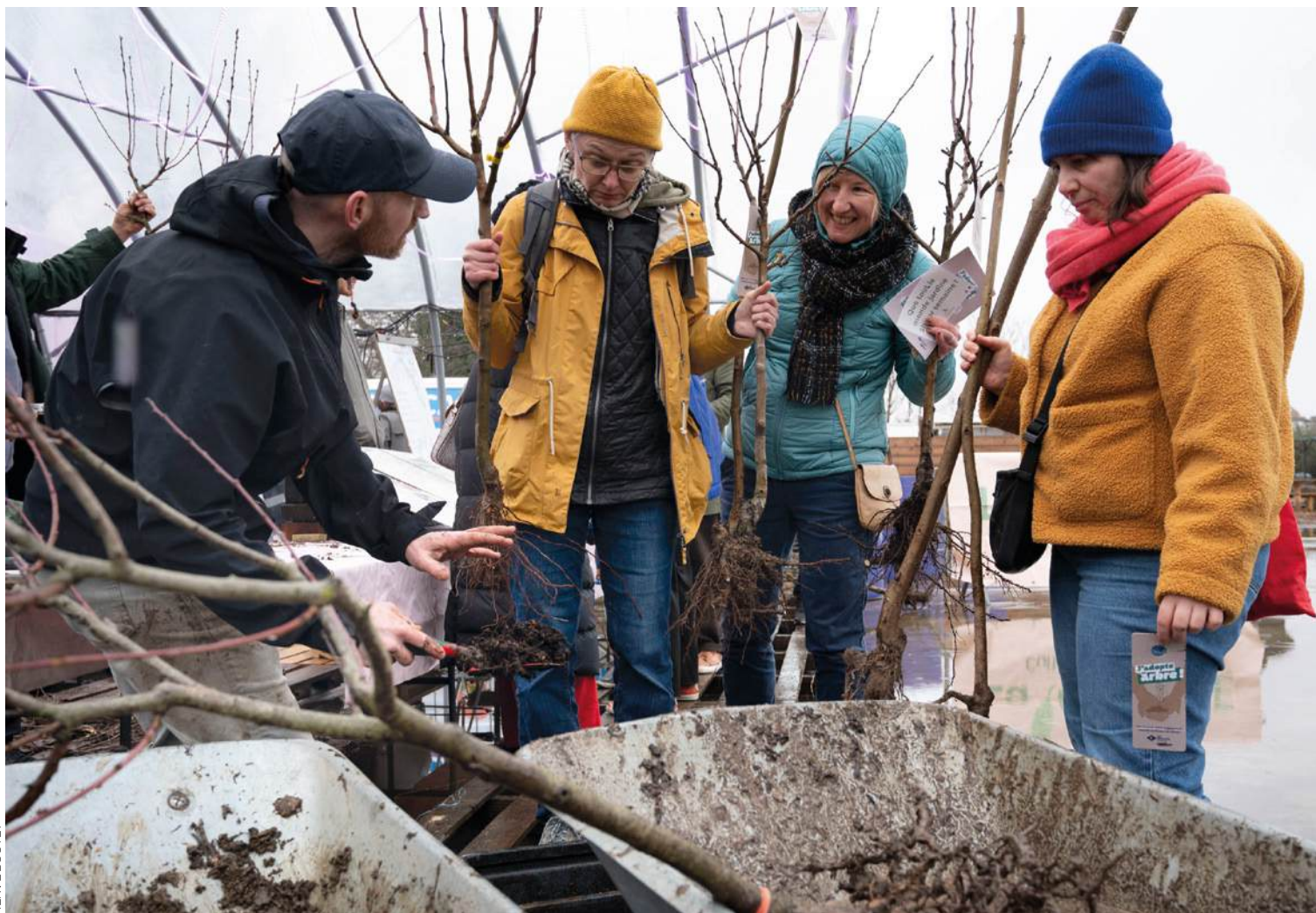
Le 2 mars dernier, les habitants de l'intercommunalité Est Ensemble venaient chercher les arbres qu'ils avaient adoptés.

Sont concernés par l'opération d'Est Ensemble « J'adopte un arbre » les propriétaires, copropriétaires mais aussi locataires (habitant dans une copropriété, un pavillon individuel ou un immeuble appartenant à un seul propriétaire) disposant d'un espace extérieur de pleine terre. En adoptant gratuitement un arbre dans leur jardin, chacune, chacun pourra apporter sa contribution au plan « 20 000 arbres sur notre territoire » lancé en 2022, et ainsi lutter contre les îlots de chaleur urbains et favoriser la biodiversité. Cette année encore, une variété d'essences sera proposée, notamment des fruitiers, dont les quelque 300 adoptants de 2023 se sont montrés friands. Remplir le formulaire de demande, avec lequel n'est requis qu'un seul justificatif de domicile, ne prend que cinq minutes. Il est conseillé de ne pas tarder à le