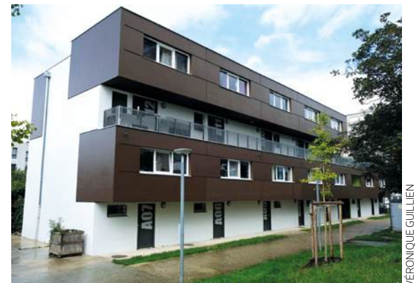
Les ateliers du Bel-Air, patrimoine public.