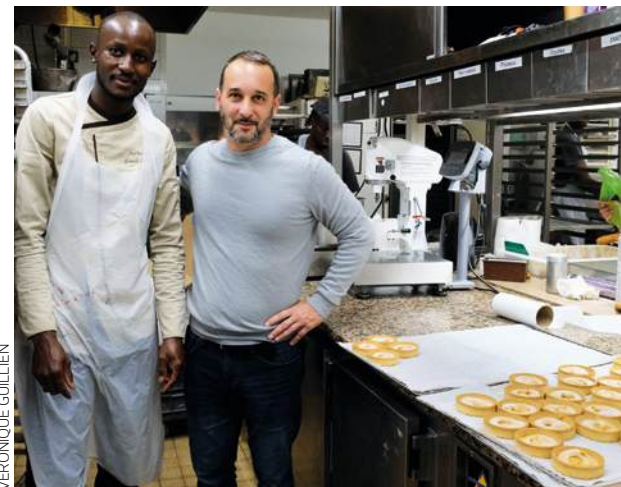
Boulangerie du Passage, 3, avenue de la Résistance, du lundi au vendredi de 6 h à 20 h 30, samedi de 6 h 30 à 20 h et dimanche de 7 h à 20 h.

même à revisiter la tradition (le flan à 4 € la part est unique !) et les formats (voir les madeleines géantes, 10 et 12 €), et l'on invente des entremets exotiques comme le Sao Paulo à la robe mangu-passion (36 € pour 6 et 5,80 € l'individuel). « Mais on ne sacrifie jamais le goût », jure le boss de 46 ans de cette institution montreuilloise dotée, au niveau inférieur, d'un laboratoire de 500 m 2 où travaillent plus de 30 salariés. « Et 100 % de la production quotidienne est réalisée sur place. » La famille Piéton, qui a géré la boutique jusqu'en 2022 – et dont le fils Florent est aujourd'hui responsable des ventes – n'a pas à rougir de son repreneur. ■