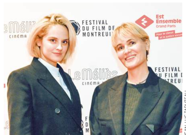
Noémie Merlant et Judith Godrèche.

Toutes deux sont porteuses d'une voix féministe au sein du cinéma français. Le 28 septembre, les actrices Noémie Merlant et Judith Godrèche ont présenté respectivement Les Femmes au balcon et Moi aussi , qu'elles ont réalisés, au cours d'une rencontre publique sur le cinéma au temps de #Metoo. Avec son court-métrage, Judith Godrèche a souhaité incarner tous les témoignages qu'elle avait reçus après la libération de sa parole. « J'ai trouvé une liberté à l'intérieur d'un cadre où les gens sont respectés. » Drôle, délirant, kitsch, gore, le film de Noémie Merlant aborde, avec un humour macabre et réjouissant, les violences sexuelles et la sororité. Écrit en collaboration avec Céline Sciamma (la réalisatrice de Portrait de la jeune fille en feu ), il est né d'une expérience d'agression sexuelle vécue par la réalisatrice. « Parfois, le problème n'est pas d'être