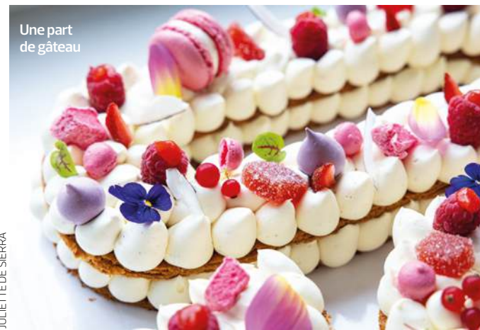
JULIETTE DE SIERRA