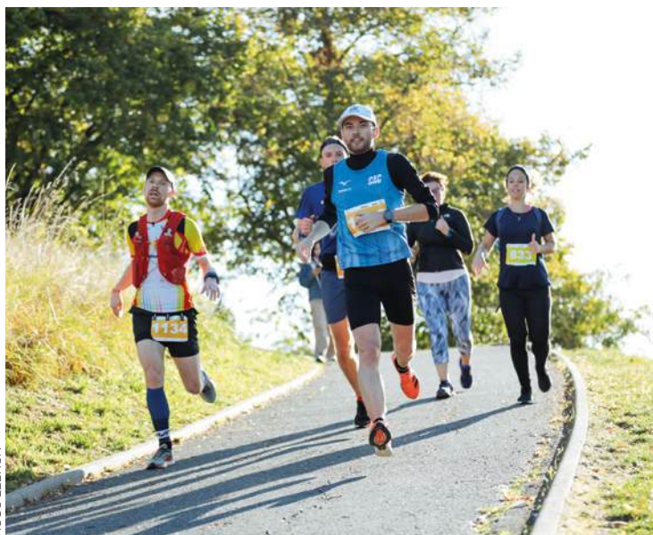
Du minitrail à la boucle de 28 km, à chacun sa course.

Organisée par la Fédération sportive et gymnique du travail de Seine-Saint-Denis (FSGT 93), avec le soutien d'Est Ensemble, cette épreuve, riche en dénivelé, et mêlant bitume et nature, est une invitation à (re)découvrir le département. Elle traversera les neuf villes de l'établissement public territorial Est Ensemble, parmi lesquelles Montreuil au niveau du parc des Guilands et des rues adjacentes. Il y en aura pour tous les âges et tous