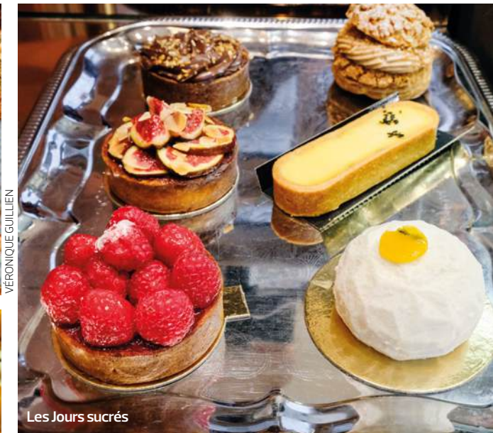
Les Jours sucrés