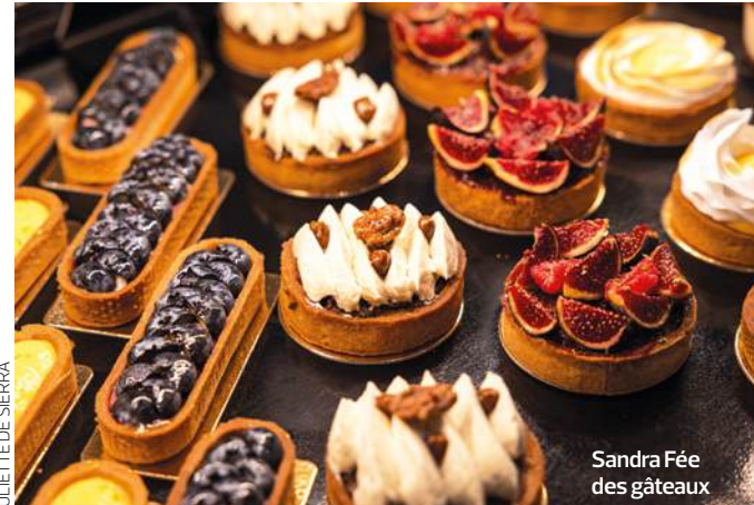
JULIETTE DE SIERRA

La Romainville, 29, bd Rouget-de-Lisle, du mardi au vendredi de 10 h à 13 h et de 14 h à 19 h, le samedi de 9 h 30 à 19 h 30 et le dimanche de 9 h 30 à 18 h, laromainville.fr