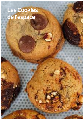
Les Cookies de l'espace